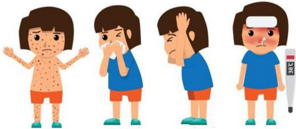
دانه های خارش دار